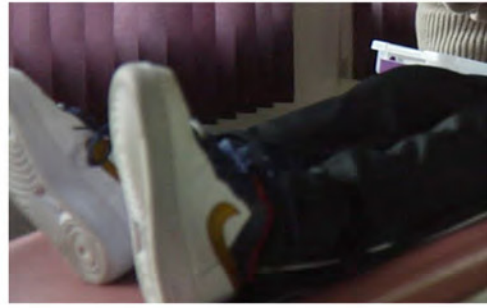
2 Piernas rectas