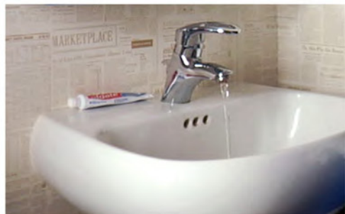
8 Escupir en el lavamanos